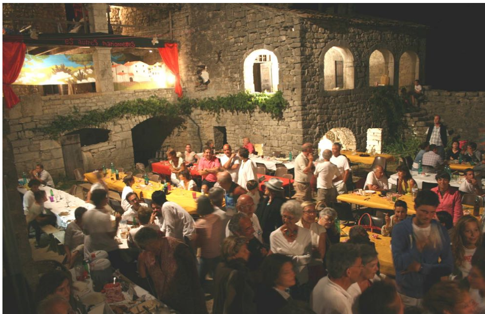
L'Abeille, le 26 août 2012